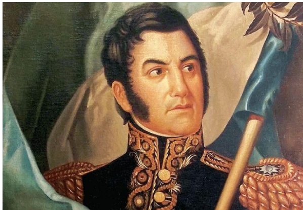
“GENERAL LIBERTADOR JOSÉ FRANCISCO DE SAN MARTÍN”

Su madre lo hizo estudiar guitarra, afición que conservó siempre y que lo llevó durante su permanencia en Francia, a tomar lecciones con el gran compositor español Fernando Sor, a quien conoció en el palacio de su futuro amigo Alejandro Aguado. Sor era un compositor destacado, su obra "Estudios", es la base de la formación de todo guitarrista aún en la actualidad y cuyos méritos le valieron el apodo de "Beethoven de la guitarra".